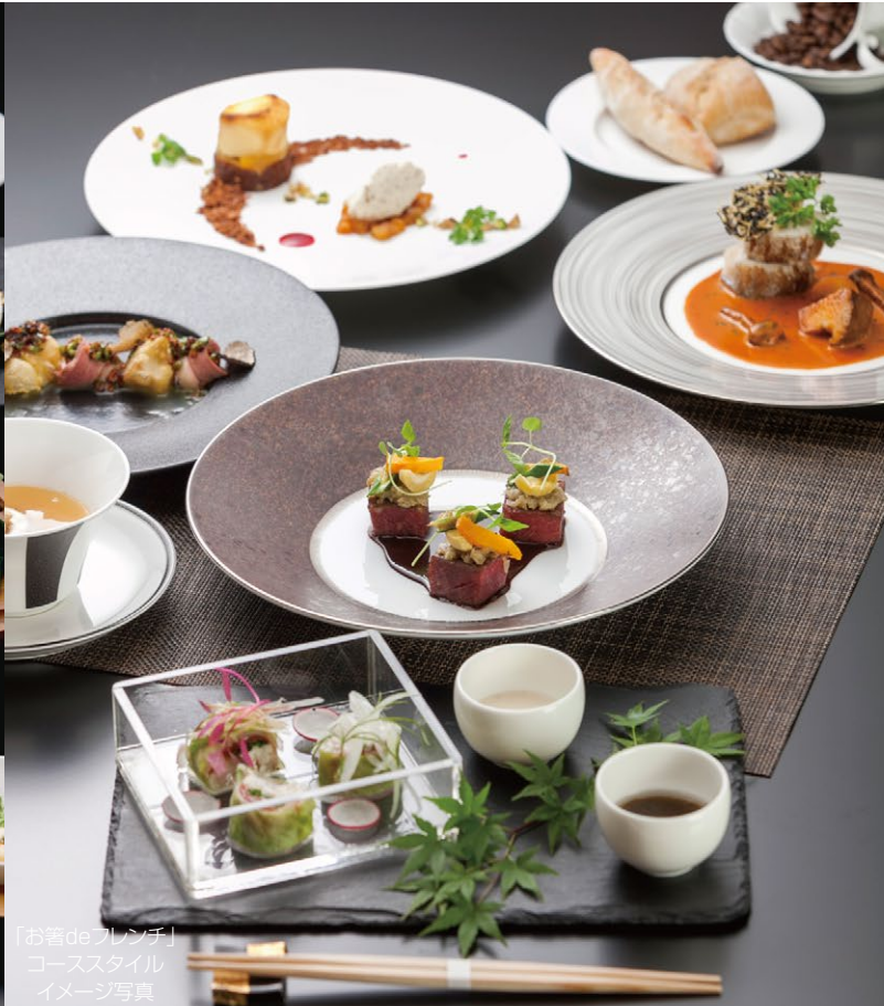
「お箸deフレンチ」 コーススタイル イメージ写真