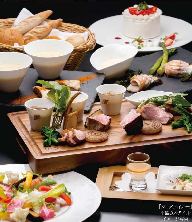
「シェアディナー」 卓盛りスタイル イメージ写真