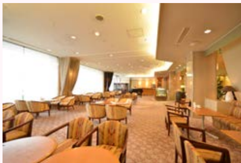
ロビーラウンジ (イメージ)